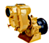
Réducteur/prise de force