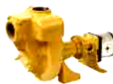
Avec moteur hydraulique